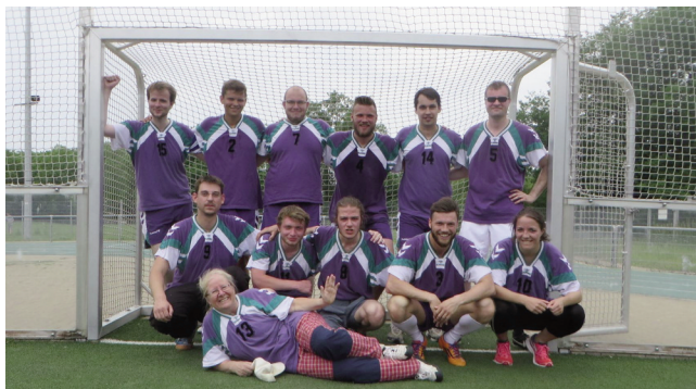
Das tollkühne Fachschaftsteam „Trinität & Tobago“ beim Uni-Turnier „Goethe kickt“

Rückblick der Fachschaft auf ein sportives Sommersemester