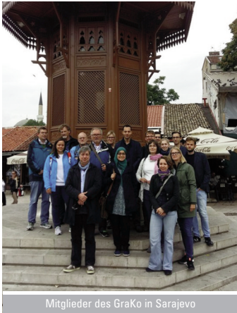
Mitglieder des GraKo in Sarajevo

Graduiertenkollegs 1728: Theologie als Wissenschaft für weitere 4 ½ Jahre verlängert