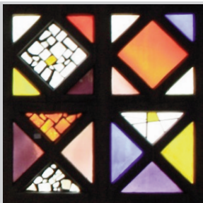
Kirchenräume in Frankfurt Rückblick auf ein besonderes Seminar der Praktische Theologie (S.14)